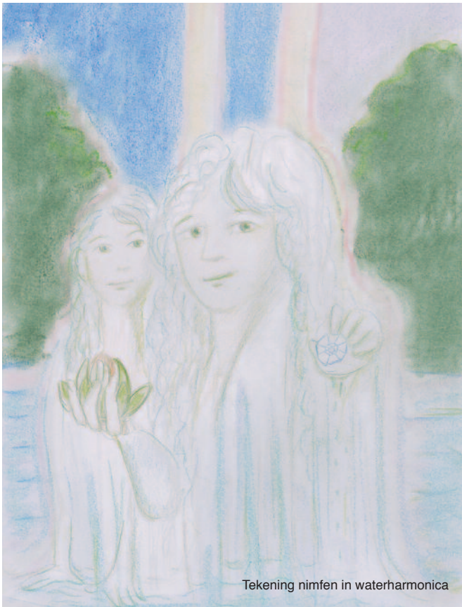
Tekening nimfen in waterharmonica